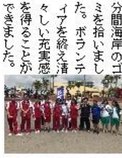
参加した生徒たち

5月28日(日)、鴨川市前原横濱海岸において開催された鴨川市と鴨川市まるこみ実行委員会主催の「まるこみ、17鴨川」に、本校のクラスや部活動の有志、12名が参加しました。夏のような日射しの中、約1時間30分間海岸のゴミを拾いました。ポランテニアを終え、清々とした気持ちで帰ってきました。