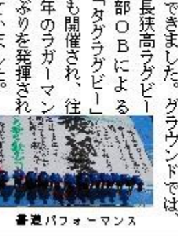
書道パフォーマンス

ッション発表など、新しい試みにチャレンジしました。校舎内では、クラス発表、文化部発表を中心に実施され、毎年人気の定時制のカレー販売も行いました。文化ホールでは、合唱部、吹奏楽部の他、有志団体によるダンスやバンドの発表を実施しました。PTAによるバザー・食品販売も盛況で、亀田医療大学・城西国際大学のみならず、集まりました。同窓会による卒業アルバムなどの貴重な展示や記録映像の放送もあり、伝統ある長狭の歴史を実感することができました。グラウンドでは、「タグラグビー」も開催され、往年のラグーマンぶりを発揮されていました。