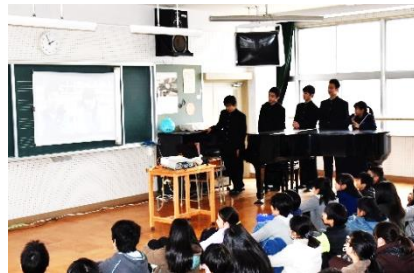
中学校説明会の様子

に、中学校の紹介ビデオを使って、部活動や行事の様子、中学校と小学校の違い等について紹介がありました。その後、中学校生活のルールについて、中学生が寸劇を披露して分かりやすく説明をしてくれました。質疑応答では、部活動の様子や中学校の雰囲気について、意欲的に質問する6年生の姿が見られました。