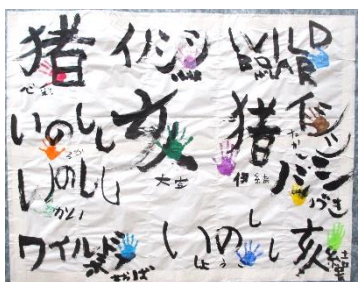
伸びゆく子教育作品展(あすなる・どんぐり学級の作品)