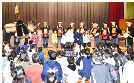
お馬頭の出前授業の様子

3年生は、総合的な学習の時間の「日進市博士になろう」の単元で、自分たちが住んでいる日進市について調べ学習をしています。その学習の一環として、米野木お馬頭保存会の方々をお招きして出前授業を行いました。ビデオを視聴したり、講師の方からお話を聞いたりして、お馬頭の起源や目的・願いなどについて学習しました。また、保存会の方々による実演では、威勢のよい掛け声をかけながら隊列を組み、馬を献上する様子を再現していただきました。子どもたちは、隊列と一緒に参加したり、鉄砲や槍、団扇等の道具に触らせていただいたりとお馬頭祭りの雰囲気味わうことができました。出前授業を通して、地元を愛する気持ちがさらに育ってくれたらと思います。