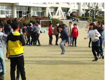
なかよし集会の様子