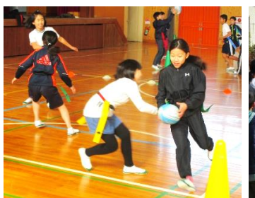
5年 タグラグビーの様子