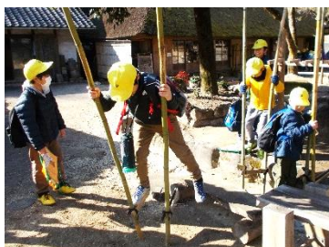
3年 三州足助屋敷の見学